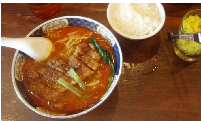
おかわり自由のライス付で満足の排骨担々麵(税込 1,000 円)。辛さは普通~激辛まで4段階、漬物は無料

銀座明倫館にお立ち寄りいただいた後に、癖になる風味の支那そばはいかがでしょうか。