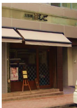
「支那麵 はしご」外観。店の右側入口より入って5階が、私ども銀座明倫館の展示場です

銀座明倫館にお立ち寄りの際には、ご一報いただけましたら新橋駅・銀座駅までお迎えに上がりますのでぜひお声掛けください。